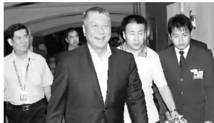
4月17日晚,澳门特别行政区行政长官何厚铨抵达博鳌。