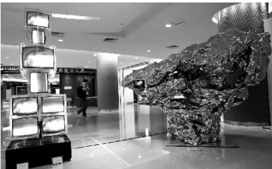
文化点染博鳌亚洲论坛

4月17日,在博鳌亚洲当代艺术展开幕式上,展出的由双声道音频音响雕塑显示器组成的名为“大提琴”的艺术品(左)和不锈钢材质的假山石名为“展望”的艺术品。本次艺术展共展出中日韩等亚洲多国代表性作品20余件。