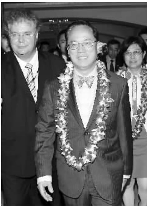
4月17日,香港特别行政区行政长官曾荫权抵达博鳌。