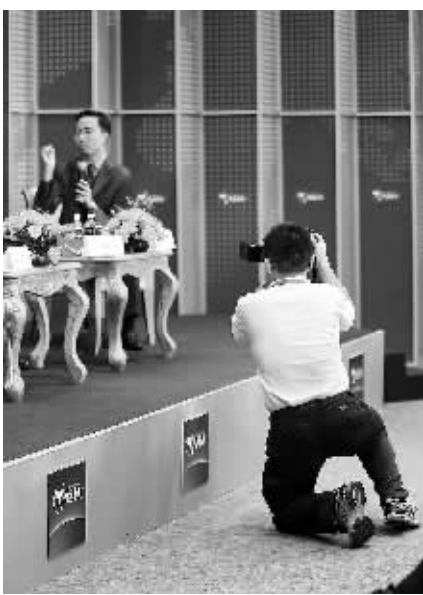
一张好照片的背后。

其中琼海市博鳌地区18日多云,天气较好,19日多云有短时阵雨,最高气温30℃至32℃,最低气温23℃至25℃;海口以多云为主,其间有短时阵雨。