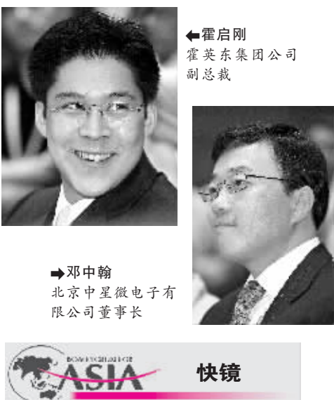
霍启刚 霍英东集团公司副总裁