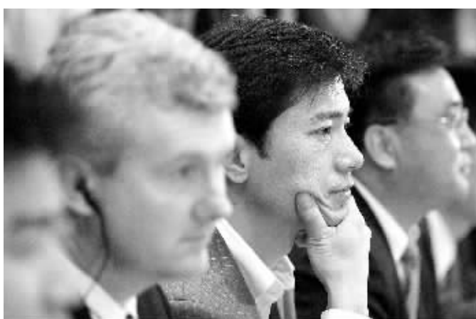
李彦宏(中) 百度CEO