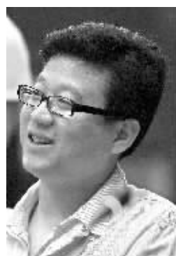
丁磊 网易 CEO