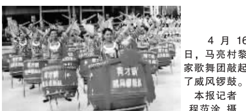
4月16日,马亮村黎家歌舞团敲起了威风锣鼓。