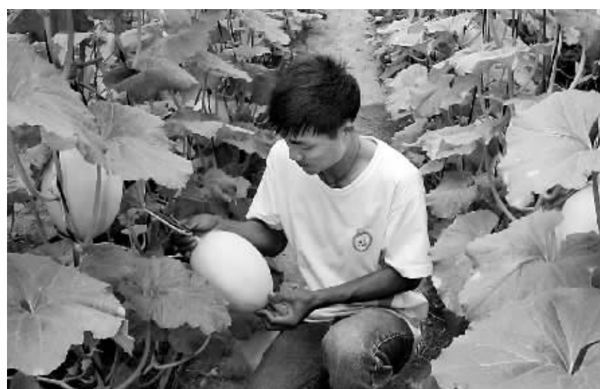
凤凰镇槟榔村设施农业基地,农民在检查哈密瓜的长势。

促进农业发展、提高农民收入、实现农村繁荣,是中央的重大战略。2007年,中央一号文件提出建设现代农业。