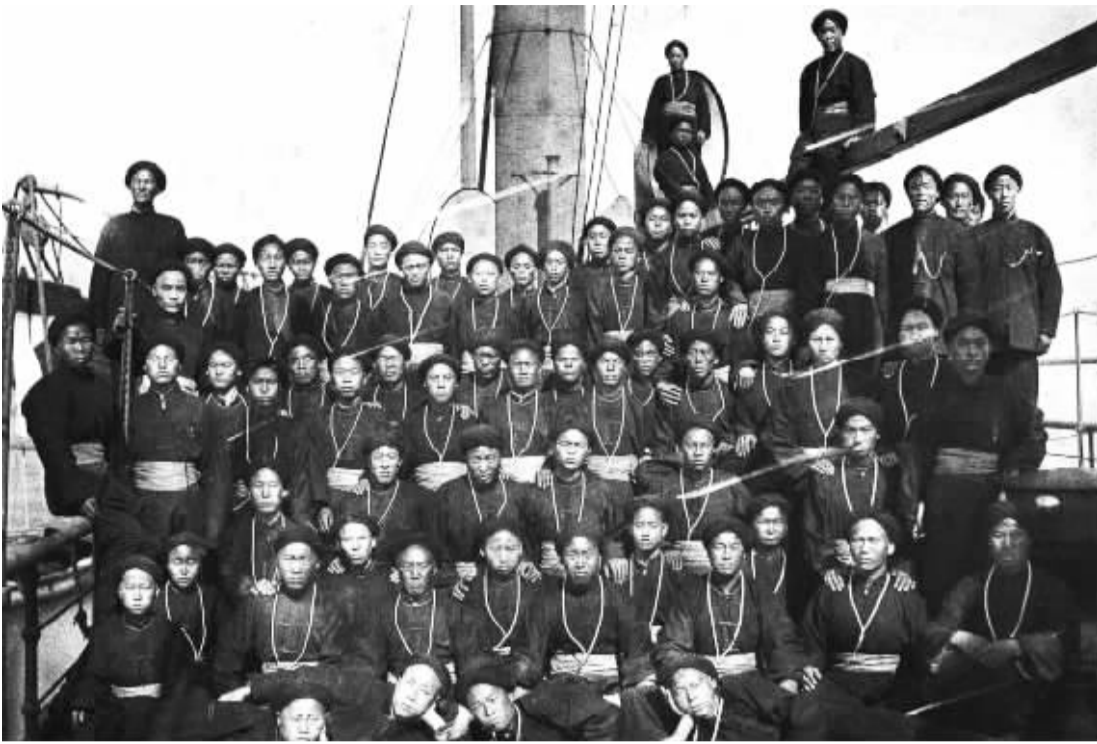
1885年前后,山东威海卫,在舰船上合影的水兵。1874年,李鸿章上奏组建北洋水师,主力战舰悉从国外购进,军事教官也大多从国外聘请。