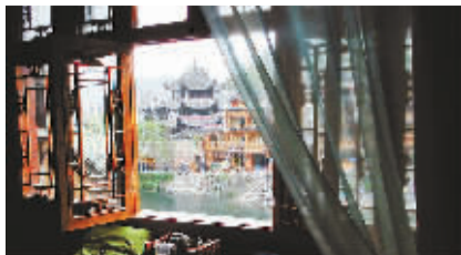
窗里窗外都是风景。