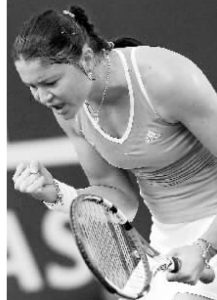
5月5日,在罗马网球大师赛女单第二轮比赛中,萨芬娜以2比0战胜拉扎鲁,晋级下一轮。郑洁2:1淘汰韦斯宁娜,晋级下一轮。图为萨芬娜在比赛中。