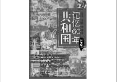
孟云剑 杨东晓 胡鹏 著 中信出版社 2009年4月

60年,于历史的长卷,是弹指一挥间,60年,于新中国,是日月换新天。该丛书并没有停留于浩瀚史实的梳理,而是从时间、地点、人物的角度分别选取典型进行叙述。丛书共分三册,包括“编年篇”、“地标篇”、“人物篇”,分别选取了60个年份、60个地标、60个人物,从时间、地点、人物三个维度对60年来共和国的历史进行梳理和解读。