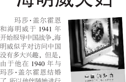
孟云剑 杨东晓 胡鹏 著 中信出版社 2009年4月

60年,于历史的长卷,是弹指一挥间,60年,于新中国,是日月换新天。该丛书并没有停留于浩瀚史实的梳理,而是从时间、地点、人物的角度分别选取典型进行叙述。丛书共分三册,包括“编年篇”、“地标篇”、“人物篇”,分别选取了60个年份、60个地标、60个人物,从时间、地点、人物三个维度对60年来共和国的历史进行梳理和解读。