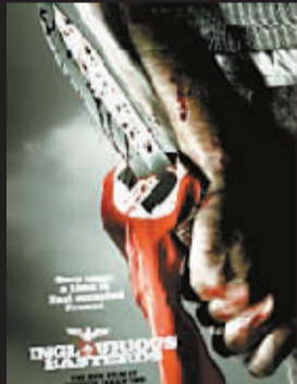
《无耻的混蛋》 导演：昆汀·塔伦蒂诺 主演：布拉德·皮特

应罗浮宫之邀拍摄的电影《脸》依旧充斥着情欲主题。片中台湾导演李康生计划在卢浮宫拍摄电影，邀来心仪已久的法国演员，但拍摄状况频出，现实和电影间的荒谬，让他接近疯狂。