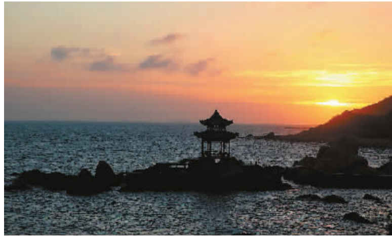
↑红日渐落,紫霞映天。 ↓鬼斧神工的礁石群。