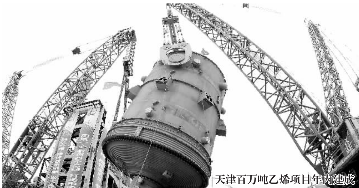
天津百万吨乙烯项目年内建成

根据《规划》,经过三年调整和振兴,我国石化产业结构趋于合理,发展方式明显转变,综合实力显著提高。