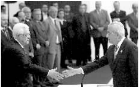
巴勒斯坦新一届政府总理法耶兹(右)宣誓时与巴民族权力机构主席阿巴斯握手。

据新华社拉姆安拉5月19日电(记者齐翔辉 华春雨)巴勒斯坦新一届政府19日晚在约旦河西岸城市拉姆安拉宣誓就职,原过渡政府总理法耶兹担任总理。