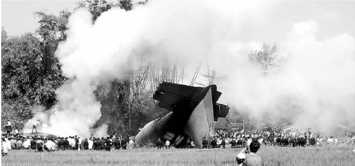
↑5月20日,在印度尼西亚东爪哇省的坠机事故现场,营救人员在失事飞机附近工作。