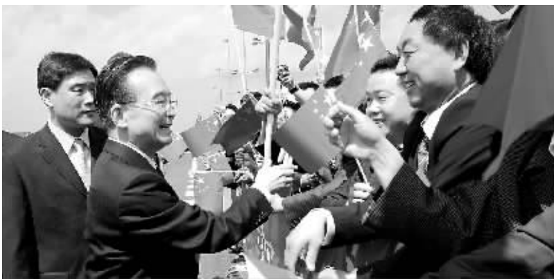
5月20日,国务院总理温家宝抵达捷克首都布拉格。

双方同意,要以实际行动反对任何形式的贸易投资保护主义。中方将在近期再向欧洲派出采购团,增加从欧洲的进口。欧方对此表示感谢。双方表示将进一步促进相互投资,加强在中小企业、贸易便利化、科技、交通、邮政等领域的合作;中方希望欧盟放宽对华高技术产品出口限制,培育中欧经贸合作新的增长点,推动贸易投资持续增长。双方同意加强在宏观经济政策和财金领域的对话,密切沟通和协调,共同推动国际金融体