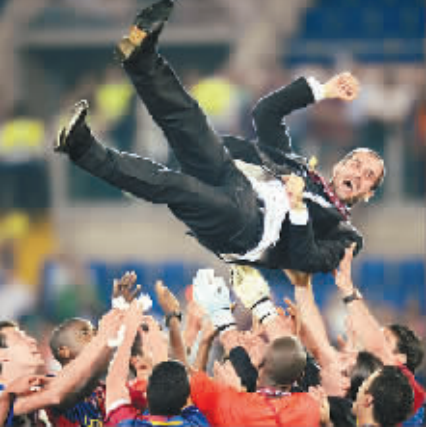
巴萨队员将瓜迪奥拉抛向空中。

瓜迪奥拉在执教巴萨一线队之前，瓜迪奥拉仅仅是一个将巴萨二队从丁级带到丙级的教练。严格意义上来说，08/09赛季才是瓜迪奥拉在世界舞台上的处子秀。而这一年则是无比辉煌的，巴萨联赛中两回合双杀皇马，在伯纳乌6:2血洗皇马，提前三轮夺得西甲冠军，夺得俱乐部历史上第25座国王杯冠军，巴萨俱乐部历史上第三座欧冠冠军，创造西班牙足球历史纪录的联赛、杯赛、欧冠“三冠王”……一切的一切，都是这个“菜鸟”教练获得的，很难想象哪一个名帅能在这样的年龄、这样的处子赛季就获得至高的成绩。在欧洲职业足球历史上，仅有阿贾克斯、凯尔特人、埃因霍温、曼联、巴萨获得过联赛、杯赛、欧冠“三冠王”，像瓜帅这般处子赛季便带队创下佳绩的是绝无仅有的。瓜迪奥拉开创了足球历史上一个新的纪录！(伊克)