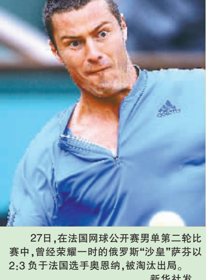
27日，在法国网球公开赛男单第二轮比赛中，曾经荣耀一时的俄罗斯“沙皇”萨芬以2:3负于法国选手奥恩纳，被淘汰出局。