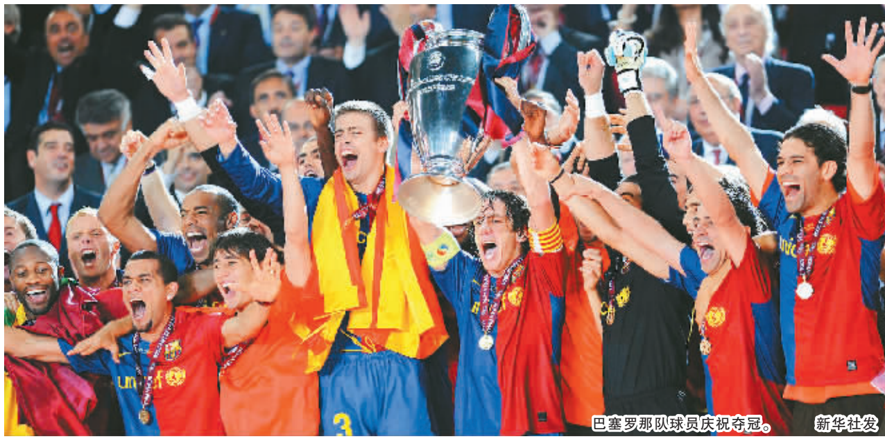
巴塞罗那队球员庆祝夺冠。

夺得三个冠军的巴萨已经成为了传奇，西班牙球评家说：“世界上有好的球队，有平庸的球队，还有糟糕的球队，但巴萨这三个等级都不属于，它凌驾于一切球队之上，漂浮于一个不为人所知的维度空间。”对巴萨来说，最重要的还不是夺得三个冠军，而是球队对漂亮足球的追求获得了最公平的回报。这支巴萨始终忠实于自己的风格，忠实于自己的足球理念，将为球迷送上最高等级的享受放到第一位。决赛的胜利不单是巴萨的胜利，还是足球本身的胜利。巴萨寻找伟大，寻找享受，最终让自己变得伟大，让球迷获得享受。对曼联的比赛，巴萨持续不断的传递，让强大的曼联成为了一支平庸的球队。出色的数据就是巴萨足球最优秀的证明。