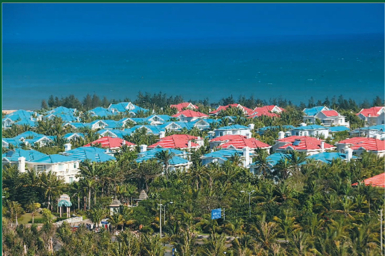
许多外地人选择海口作为第二居住地