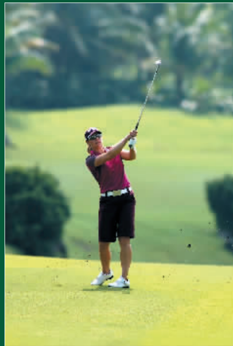
海口积极发展高尔夫产业