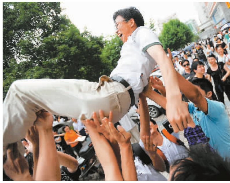
6月8日,长沙市一中考点外,结束高考的考生把班主任高高举起。

新华社北京6月8日电(记者吴晶、王尧)除江苏、上海、广东、海南、山东等5省市外,全国26个省区市的高考已于8日17时结束。江苏、上海、广东、海南、山东等5省市由科目设置不同,还将于9日继续进行考试。各地高考成绩将于6月下旬陆续公布。自6月10日至15日起,全国逾2400所高校将在教育部“阳光高考”信息平台上参加“2009年全国普通高校毕业生网上咨询周”,面向广大考生开展报考咨询。咨询周的网址为: http://gaokao.chsi.com.cn 或 http://gaokao.chsi.cn 每日咨询时间为9时至17时。