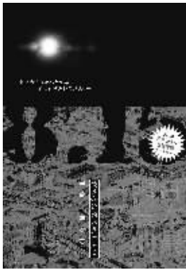
《日本最漫长的一天》 半藤一利著 2009年 5 月 重庆出版社

描述，在揭开了那段历史的神秘面纱的同时，也使得人们对日本战败决定投降的过程有了更加全面的了解。