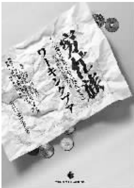
《穷忙族》 门仓贵史著 2009年 6 月 中信出版社

些一壶廉价茶叶兑开水就要几十元的某某吧里，讨论着不同车型的油耗、提速、舒适性。我们中的佼佼者甚至在关心第二套房的选址和时下的房价。