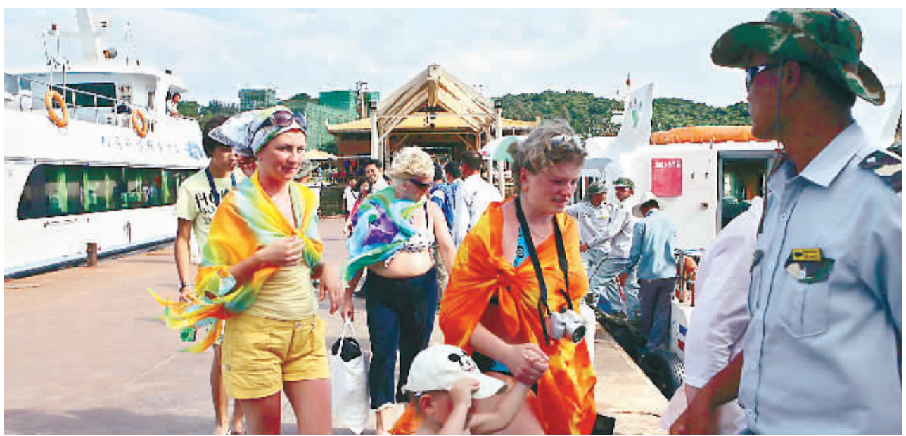
三亚的碧海蓝天和国际品牌酒店,吸引了众多游客。图为6月21日下午外国游客登陆蜈支洲岛。

在三亚海边,令各地游客心旷神怡的不仅是碧海蓝天,还有集群成片、颇为壮观的国际度假酒店群。从中国首家度假酒店落户至今,风格各异国际品牌酒店一直是三亚国际化进程中的探路者。从1家到18家,国际顶级酒店管理集团纷纷抢滩三亚。