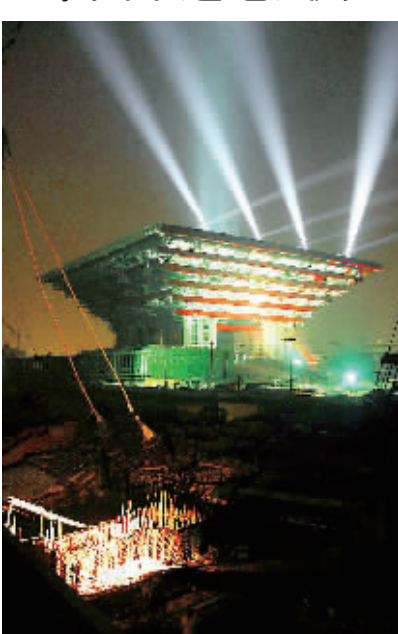
6月22日晚,2010年上海世博会中国国家馆通电试灯,灯光将中国馆点亮。目前,中国馆已进入内部装饰阶段。