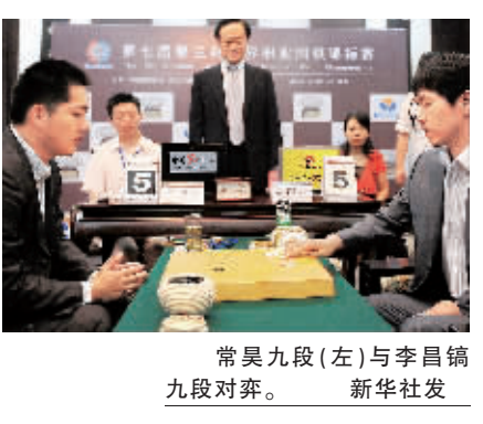
常昊九段(左)与李昌镐九段对弈。

据新华社成都6月22日电(史春东 孙英杰)第七届春兰杯世界职业围棋锦标赛决赛22日在成都武侯祠战罢第一局。经过241手的激烈搏杀,中国的常昊九段在极其困难的情况下执黑中盘战胜韩国的李昌镐九段,先下一城。