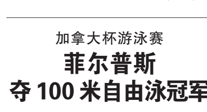
菲尔普斯在游泳比赛中。 新华社发

据新华社渥太华6月21日电,北京奥运会八金得主菲尔普斯(见上图,新华社发)21日在蒙特利尔举行的加拿大杯游泳锦标赛中,夺得男子100米自由泳冠军。赛后他表示,希望在7月开战的世锦赛选拔赛上进一步提升成绩。