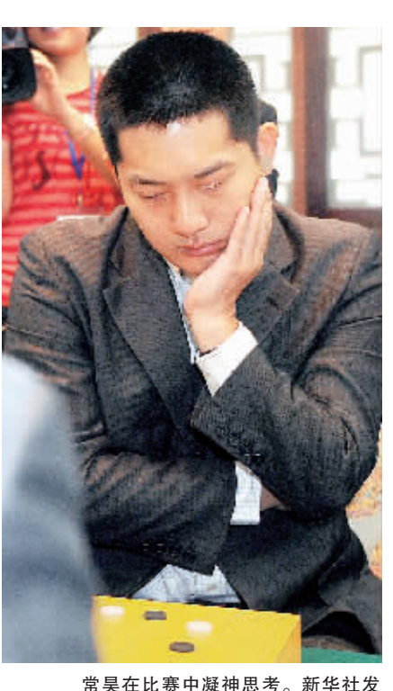
常昊在比赛中凝神思考。

6月22日,在第7届春兰杯决赛首局比赛中,常昊执黑中盘战胜李昌镐九段,拔得头筹。