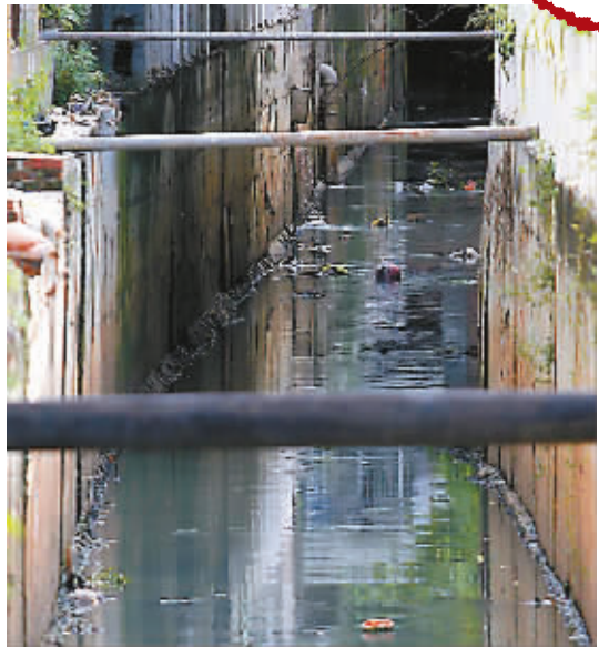
龙昆沟支流道客村与金牛园之间河段，漂浮着生活垃圾。