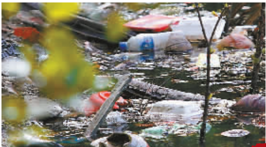
鸭尾溪东段海口市人民医院后面，大量垃圾漂浮在水面上。