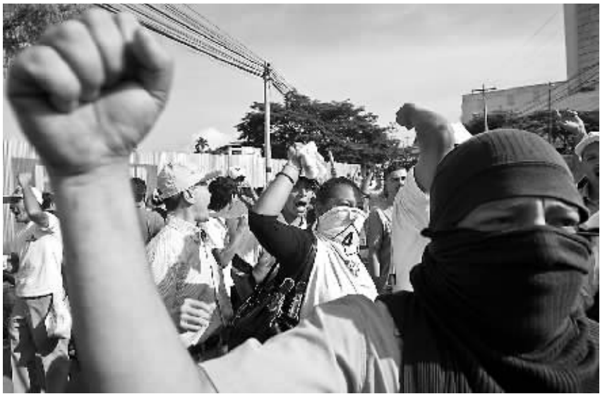
6月28日,在洪都拉斯首都特古西加尔巴,民众在总统府门前集结,阻止军队继续进驻总统府并要求释放总统塞拉亚。