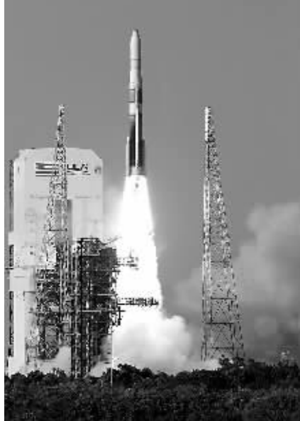
美国东部时间6月27日18时51分,德尔塔-4型火箭将一颗环境气象卫星发射升空,它将服务于美国的气象预报及气候科研工作。

塔库尔说,孩子们遭雷击时正在季风带来的大雨中玩耍,强风夹带着暴雨将树连根拔起,许多房屋和电缆受损。