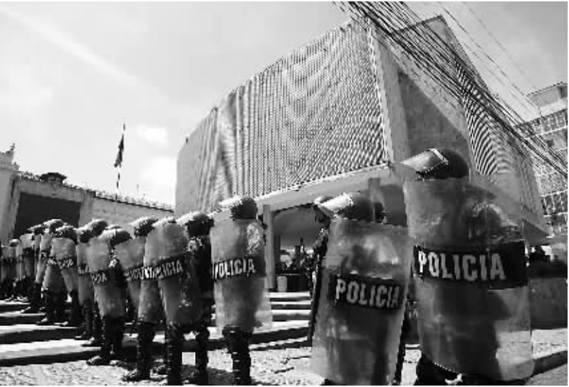
6月28日,洪都拉斯士兵在首都特古西加尔巴警戒。