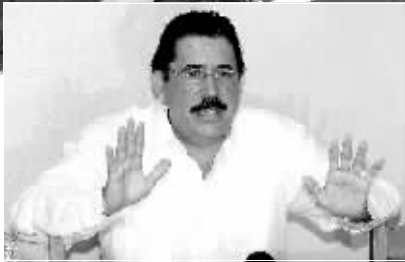
6月28日,被洪都拉斯最高法院罢免了总统职务的塞拉亚在哥斯达黎加首都圣何塞举行新闻发布会,表示他仍然是洪都拉斯的合法总统。 新华社发

最高法院宣布罢免塞拉亚前,洪都拉斯国民议会议长罗伯托·米切莱蒂召集全体议员召开紧急会议。会议决定根据洪都拉斯现行宪法,由米切莱蒂担任临时总统,完成塞拉亚余下任期,直至明年1月27日向权力移交。今年11月29日新一届总统选举获胜者。