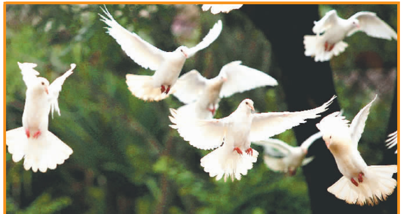
↑体态洁白展翅优雅的广场鸽,给人一种和谐悦目的感觉。

未向厂家索取营业执照、产品合格证明等有关材料,违反了进货检查验收制。且当事人销售的塑料袋未标明合格产品标志、可降解标志,经海口市质监局检验证实,厚度小于0.030毫米,属于不合格产品。