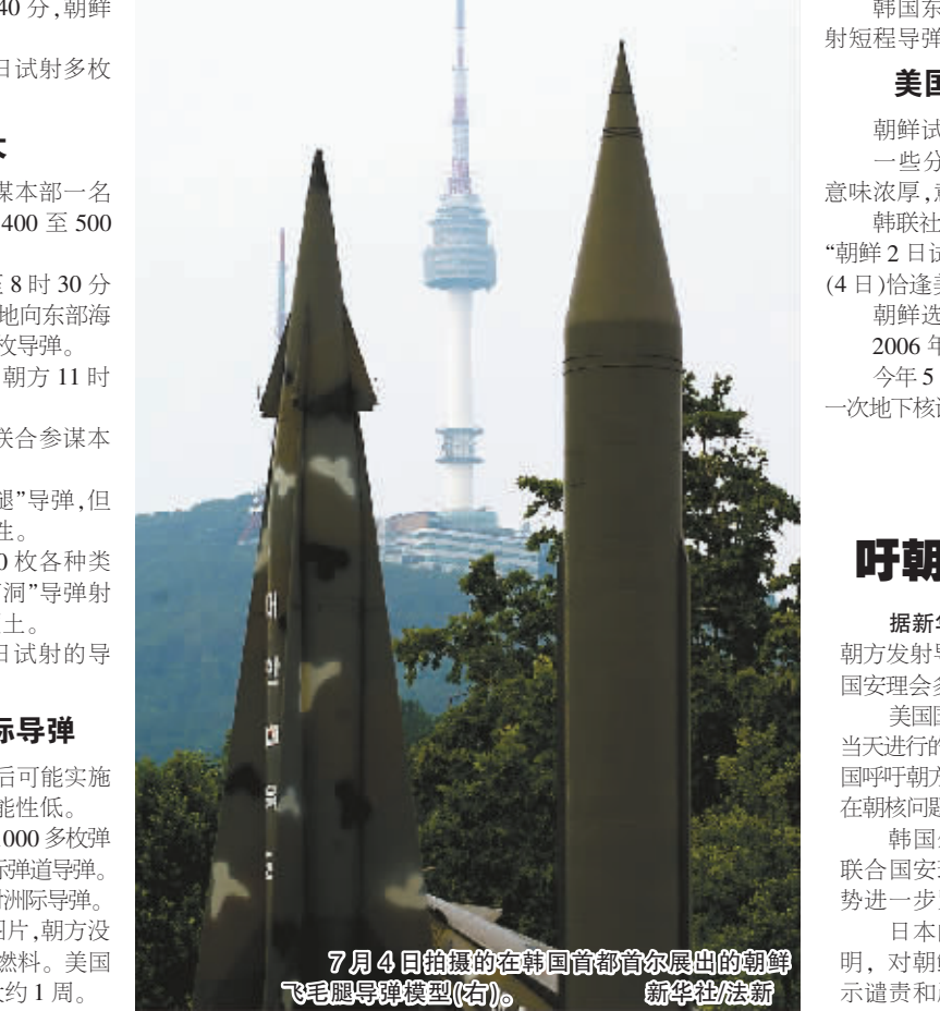
7 月 4 日拍摄的在韩国首都首尔展出的朝鲜飞毛腿导弹模型(右)。

韩国和美国一些政府官员预计,朝鲜今后可能实施更多导弹试射,但现阶段试射洲际导弹的可能性低。 美国一些军事专家估计,朝鲜现阶段拥有 1000 多枚弹道导弹,多数为短程和中程弹道导弹,也包括洲际弹道导弹。 韩国政府认为,没有迹象表明朝鲜准备试射洲际导弹。 美国军方说,根据卫星拍摄的朝方基地图片,朝方没有将洲际弹道导弹运上发射架或者开始加注燃料。美国估计,朝鲜发射洲际弹道导弹准备工作为时大约 1 周。