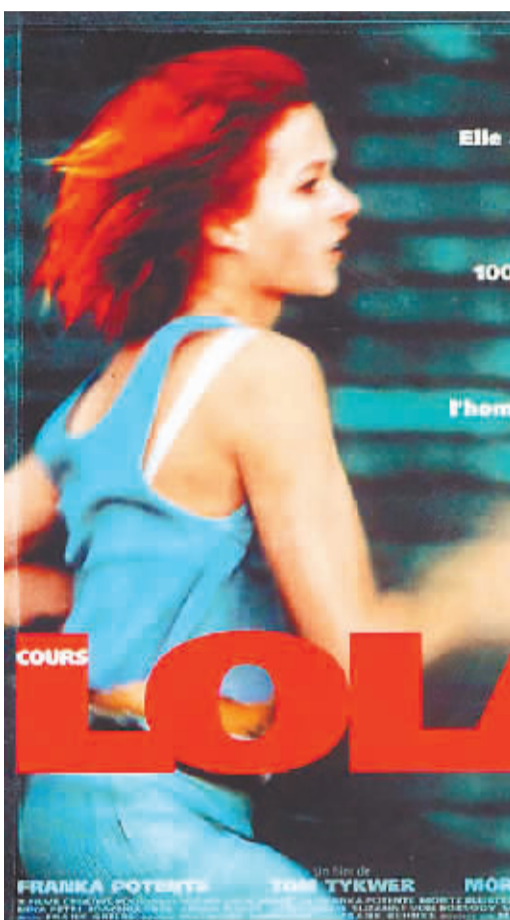
《罗拉快跑》 导演：汤姆·提克威 主演：弗兰卡·波坦特 莫里兹·布雷多 约阿希姆·科尔 类型：爱情 / 惊悚 / 剧情 / 犯罪

一个有信念的人就像一具上满发条的钟,会拥有用之不竭的动力来实现自己的目标和梦想。《火战车》中的亚伯罕斯便有这样的信念,他努力地跑,努力地争冠,不仅是为了荣誉,更为