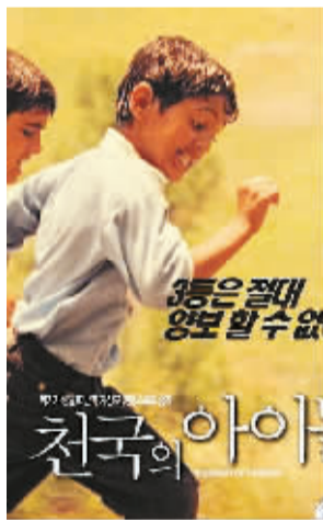
《小鞋子》(伊朗) 导演：马基德·马基迪 主演：默罕默德·阿米尔·纳吉 类型：剧情 / 喜剧