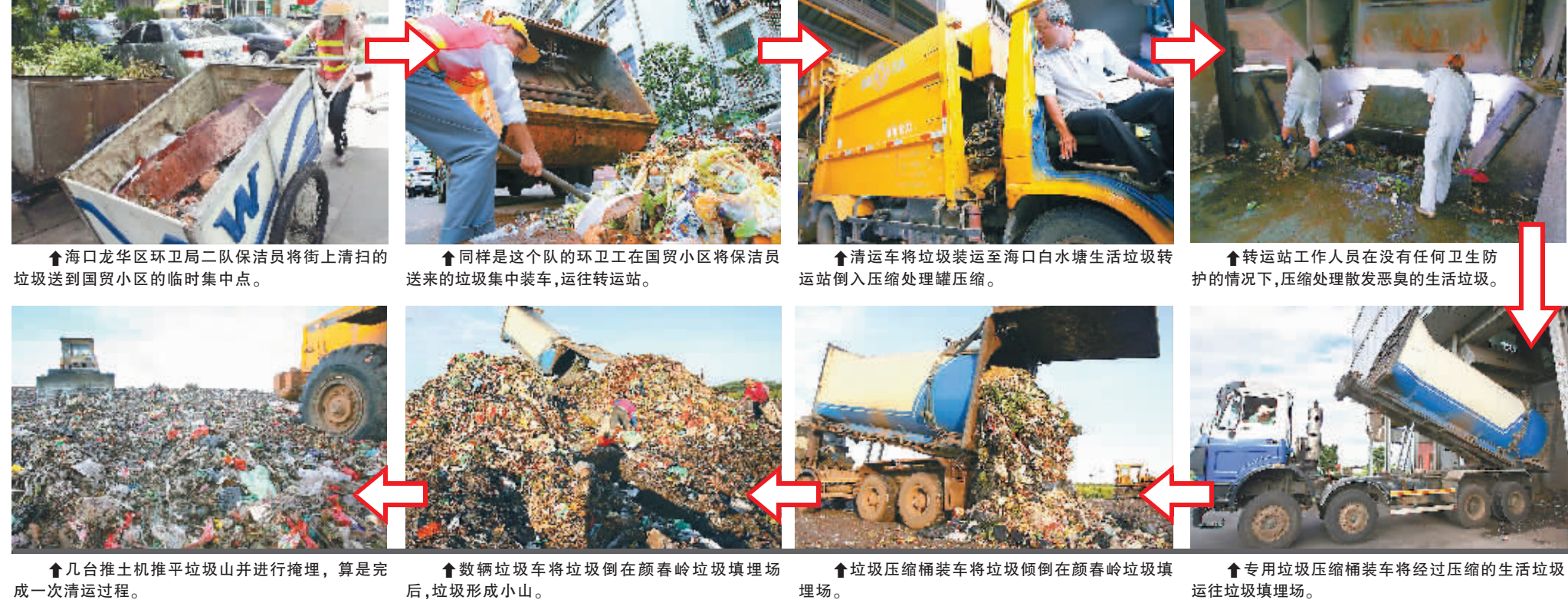
↑海口龙华区环卫局二队保洁员将街上清扫的垃圾送到国贸小区的临时集中点。