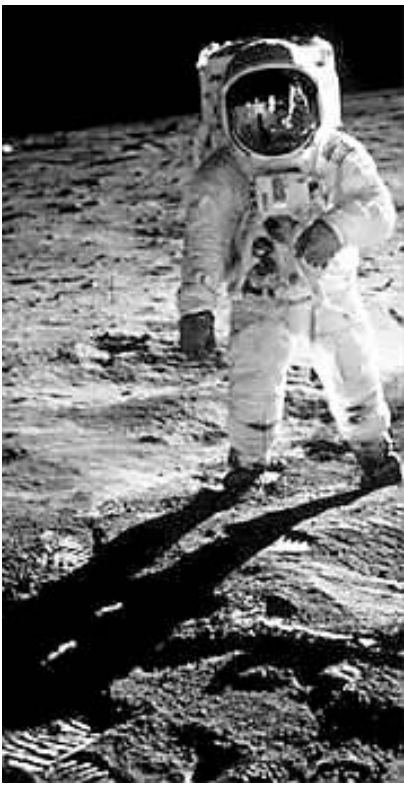
1969年7月20号,阿波罗11号宇航员奥尔德林站在月球上。