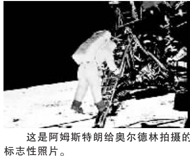
这是阿姆斯特朗给奥尔德林拍摄的标志性照片。