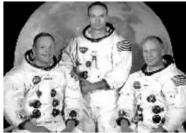
阿姆斯特朗(左)、柯林斯(中)、奥尔德林(右)1969年拍摄的合影。