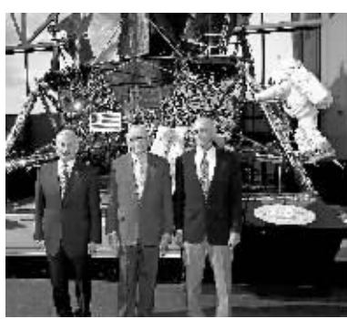
3名宇航员巴兹·奥尔德林、尼尔·阿姆斯特朗和迈克尔·柯林斯(从左至右)在华盛顿的美国国家航空航天博物馆一起参加一场演讲会。