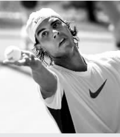
7月20日,西班牙网球名将纳达尔在西班牙马纳科尔参加今年夏天膝盖受伤后的首次适应性训练。

据新华社巴黎7月19日电(记者李学梅)19日,环法自行车赛在阿尔卑斯山的崇山峻岭之间上演了一场激情对决,与前几天平地赛段波澜不惊形成鲜明对比的是,选手们实力在这一赛段立见高下,结果2007年环法总冠军孔塔多展现出超强的实力,他不但以绝对优势豪取赛段冠军,还将黄色领骑衫收入囊中。