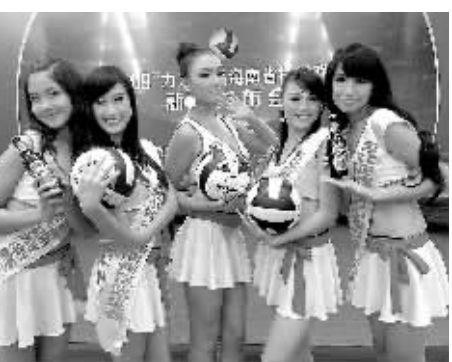
7月20日,在省排球联赛新闻发布会上,5位“亚姐”进行模特秀表演。

本报海口7月20日讯(记者林永成)王黎刚2009“力加杯”省排球联赛新闻发布会上最大的亮点,要数5位参加“亚洲小姐”华南大区海南赛区总决赛选手的登场走秀,5位“亚姐”身着红色的力加服装,变身成为醒目时尚的“力加排球宝贝”,以模特秀的方式,展示排球这项运动的青春与活力。