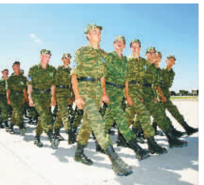
俄方官兵进行分列式训练

——看联合保障。 在两国军队联合行动中,自我保障比较困难,但联合保障比较容易。在联合保障中,通用保障相对容易,但专用保障保障比较困难。如粮食、油料的保障相对容易,但装备备件和弹药的保障就比较困难。如果在联合演习中能够有效解决这些问题,就是很大的收获。