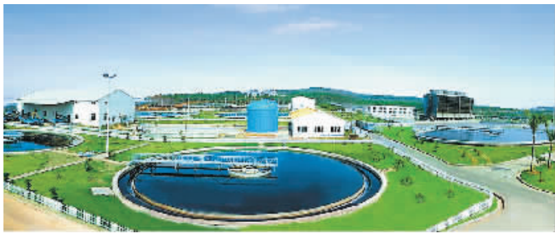
金海浆纸：环保制浆 保护生态