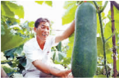
海南无公害瓜菜叫响大江南北