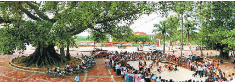
文明花开放异彩 载歌载舞乐陶陶