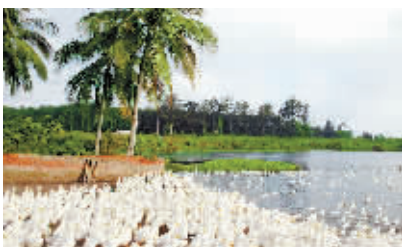
发展农村经济，增加农民收入，是文明生态村建设的核心。