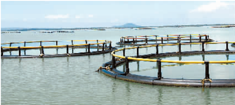
生态养殖模式——深水网箱养鱼悄然崛起

海南充分发挥热带海岛特有的“光、热、水、土”资源和海岛旅游资源优势，大力发展生态农业、生态旅游等生态型产业及循环经济，寻求节能、环保、高效的经济增长方式，探索一条生产发展、生活富裕、生态良好的文明发展之路。