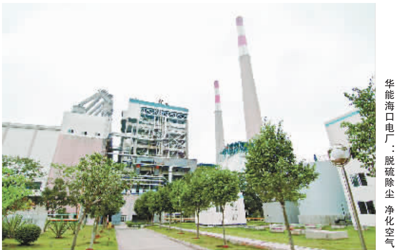
华能海口电厂：脱硫除尘 净化空气