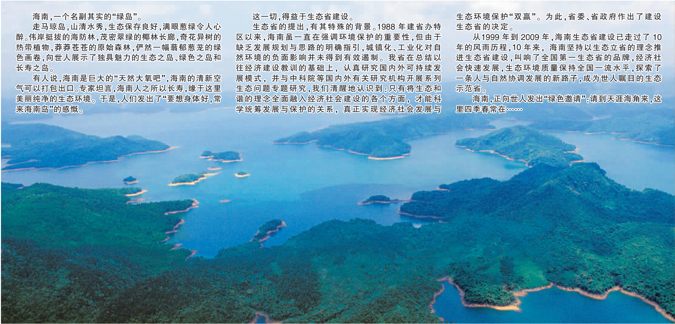
海南处处青山绿水，是备受世人青睐的“生态岛”。图为“宝岛明珠”松涛水库。