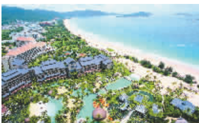
生态旅游日渐升温