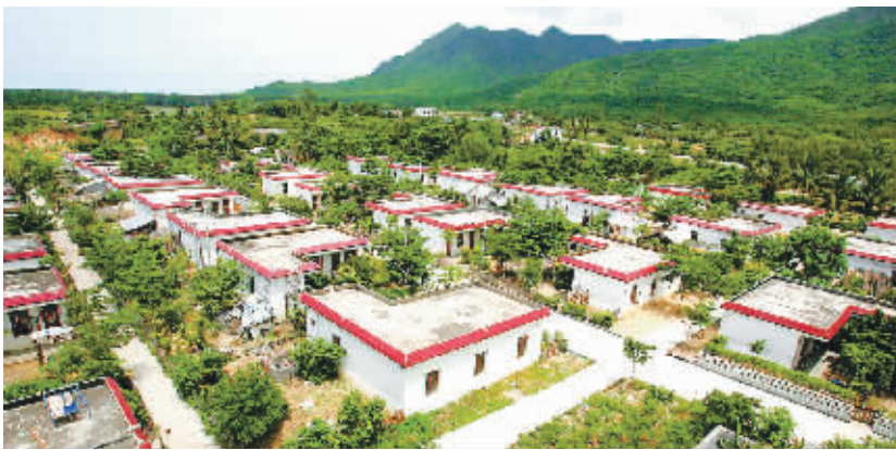
文明生态村已成为海南一张靓丽的名片

生态省建设 10 年来，海南坚持以人为本，以生态文明系列创建为载体，开展园林城市、绿色社区、生态住宅小区、环境优美乡镇、文明生态镇、文明生态村、小康环保示范村创建活动，建设一流的人居环境，提高人民生活质量，构建和谐海南。文明生态村已成为叫响全国的生态品牌。