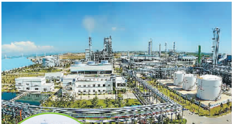
中海石油化学股份有限公司：清洁生产 节能减排