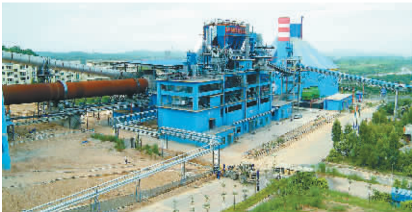
海南华盛天涯水泥有限公司投入巨资兴建余热发电项目，大力发展循环经济，实现了环保与经济效益“双赢”。