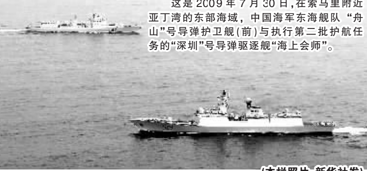
这是2009年7月30日,在索马里附近亚丁湾的东部海域,中国海军东海舰队“舟山”号导弹护卫舰(前)与执行第二批护航任务的“深圳”号导弹驱逐舰“海上会师”。