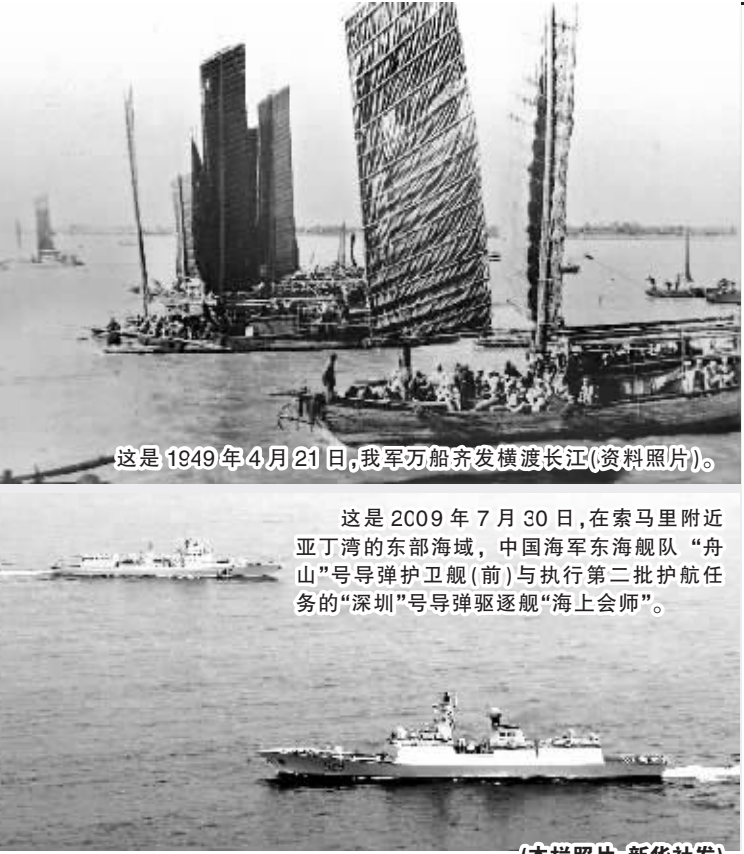
这是1949年4月21日,我军万船齐放横渡长江(资料照片)。