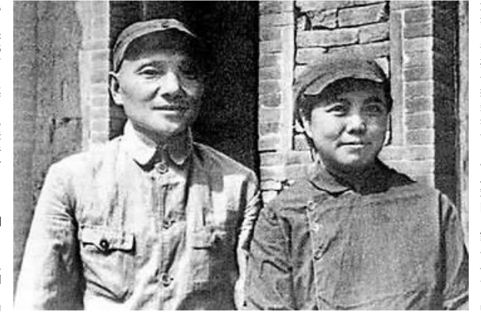
邓小平卓琳的婚姻:在毛泽东窑洞前办婚礼。

国人流下了激动的眼泪。 无论身处低谷还是走向辉煌,她对他,不会有丝毫的改变。风雨同舟,相濡以沫,这八个字是他们感情最真实的写照。 1997年2月,邓小平走了,留下孤独的她。时年81岁的卓琳眼含热泪,强忍悲痛,用颤巍巍的双手,捧起小平的骨灰,久久不愿放手,她一遍又一遍地呼唤着丈夫的名字,泣不成声…… 只是,心愿未了,那是他的心愿,也是她必须要代他完成的心愿。 1997年,香港回归的时刻,卓琳穿上了儿女为她特别订制的新衣服,踏上香港的土地,完成邓小平“到自己的土地上走一走、看一看”的风愿。 如今,家中那合用了30多年的油漆已剥落的木衣柜中,还挂着她在香港穿过的一件红色外套和一件深蓝色中式外套,衣服外面是她亲手套上的防尘塑料袋。 邓榕说:“当时,中央提出请妈妈作为中国政府代表团的一员参加香港政权交接仪式。她特别激动,因为她知道自己已是代表爸爸去的。在香港回归前的那一夜,妈妈彻夜未眠。她说,我能代表小平同志完成这个遗愿,他在九泉之下也会感到高兴和欣慰的。” 两年多后,她在澳门,见证了又一个永恒的瞬间,再次告慰了小平的心愿。她对他付出的,是一种忠诚的信仰,远远超越了妻子对丈夫的爱。 邓榕说:“妈妈和爸爸分享的,不仅仅是一个家庭,还有他的政治理想,他的人生追求。” 因为爱,她这一辈子只有付出,没有索取,用和谐融洽的家庭氛围,安抚他忧国忧民的思虑 “妈妈心里没有她自己,她爱自己的丈夫,爱这个家,爱她的孩子,对所有的亲戚和朋友真诚相待,但是她心里唯独没有她自己。”邓榕,卓琳的小女儿,抚摸着院内的花木深情地说。 是啊,熟悉的人都知道,她这一辈子只有付出,没有索取。但是她获得了大家的爱,赢得了大家的尊敬。 在邓小平的办公室中,一盏绿灯罩的小台灯仿佛诉说着一段段回忆—— 就是在这盏小台灯下,卓琳夜复一夜亲手为女儿抄写着一本本数学竞赛的习题,因为邓楠爱做数学题,而习题册是向老师借来的; 就是在这盏小台灯下,卓琳一边打着全家孩子们的毛衣毛裤,一边为儿子默字,因为小儿子太调皮,总要妈妈督促; …… “妈妈认为自己的主要任务就是把家管好,把孩子照顾好,不让爸爸操心。”邓林说,“虽然他们之间没有