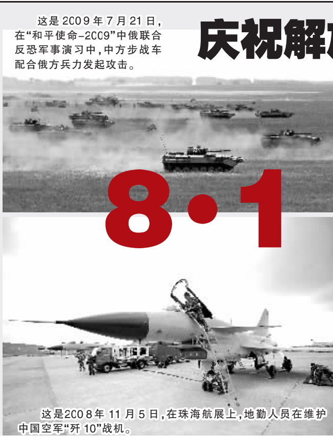
这是2009年7月21日,在“和平使命-2009”中俄联合反恐军事演习中,中方步战车配合俄方兵力发起攻击。