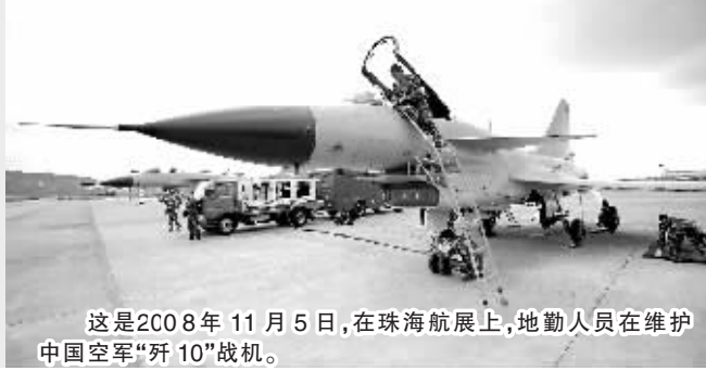
这是2008年11月5日,在珠海航展上,地勤人员在维护中国空军“歼10”战机。