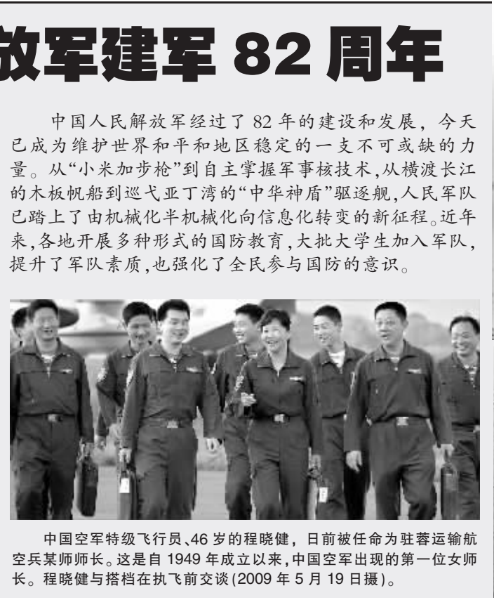
中国空军特级飞行员、46岁的程晓健,日前被任命为驻蓉运输航空兵某师师长。这是自1949年成立以来,中国空军出现的第一位女师长。程晓健与搭档在执飞前交谈(2009年5月19日摄)。