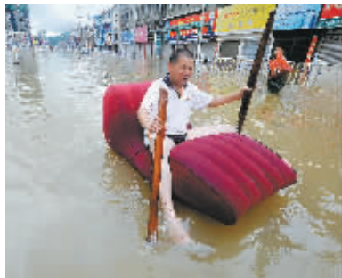
8月10日,浙江苍南一名市民坐着“沙发船”出行。

据民政部统计,截至10日19时,今年第8号台风“莫拉克”共造成福建、浙江、江西、安徽四省883.6万人受灾,因灾死亡6人(浙江省4人、福建省1人、江西省1人),失踪3人(浙江省2人、福建省1人),紧急转移安置142.9万人;农作物受灾面积387.3千公顷;倒塌房屋0.6万余间;因灾直接经济损失90.6亿元。