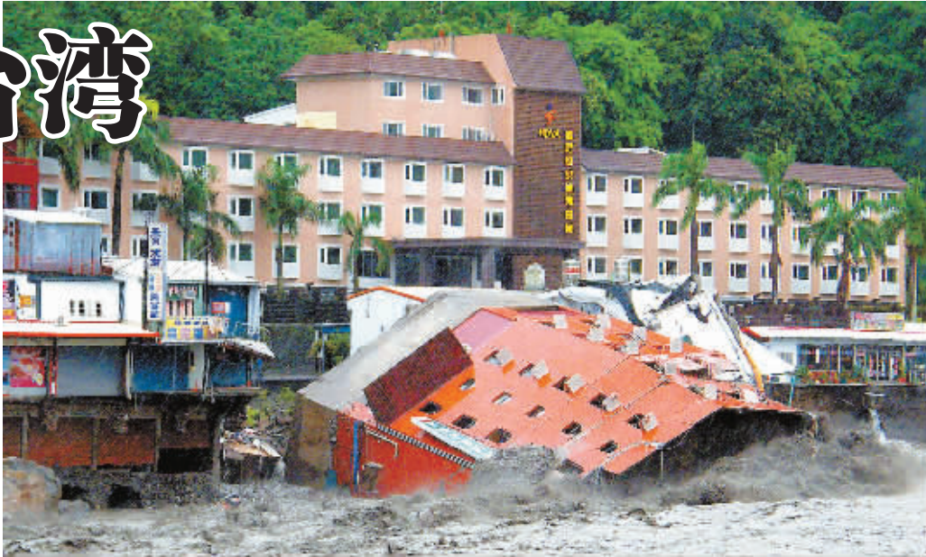
8月9日,在台东知本温泉区,6层楼高的金帅饭店被洪水冲倒。

虽然“莫拉克”暴风圈逐渐离开台湾,但中南部地区仍暴雨不断,在台东知本,洪水冲击乡镇,有300多位游客和当地居民被困,当地一座观光饭店被冲毁,场面触目惊心。