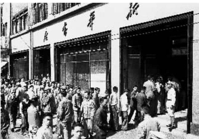
1951年10月12日,上海新华书店发行《毛泽东选集》,读者们在书店门前排队等候买书。

主办单位:中央纪委宣传教育室、中央宣传部宣传教育局、国家工商总局广告监管司、国家广电总局传媒机构管理司、新闻出版总署新闻报刊司