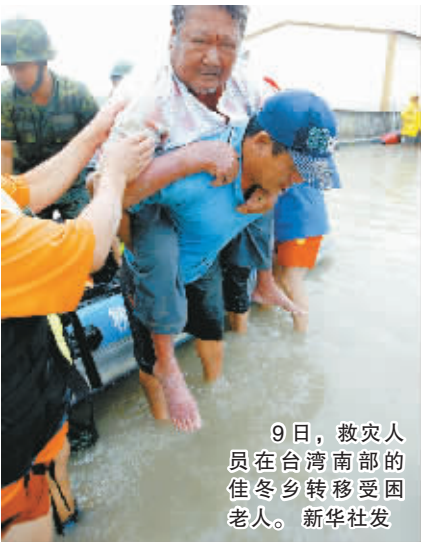
9日,救灾人员在台湾南部的佳冬乡转移受困老人。

新华社北京8月10日电 海峡两岸关系协会10日两次致函台湾海峡交流基金会,向遭受台风“莫拉克”侵袭的台湾同胞表示诚挚慰问,并愿意根据台方需要,提供必要援助。海协会函电说,据媒体报道,近日50年末遇的台风“莫拉克”侵袭台湾,造成中南部地区人员伤亡、失踪、被困及基础设施、农田民居损毁等重大生命财产损失。大陆有关方面对此高度关切,并通过海协会向死亡人员表达哀悼,向受灾台湾同胞表示诚挚慰问。衷心期盼台湾同胞战胜灾害,早日恢复正常生产和生活秩序。函电说,对于此次风灾,水灾给台湾民众造成的重大人员伤亡和财产损失,我们感同身受。愿意根据贵方需要,提供必要援助。据悉,大陆有关地方党委、政府也透过各种渠道向台湾受灾地区民众表示慰问。