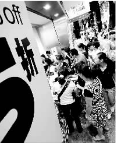
图为 8 月 11 日,一些市民在广州市北京路商业街一家打折的商店选购服装。7 月我国社会消费品零售总额同比增长 15.2%。日前,国家统计局总经济师姚景源表示,“要看到全世界的消费都在萎缩,我们能够保持这个增速来之不易。”

当前中国经济触底回升态势明显,正逐步走出企稳向好的复苏“微笑曲线”。在 7 月数据发布后,李晓超表示有六点积极变化值得注意。