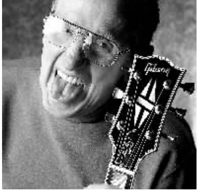
8月13日，“美国音乐大师”、“电吉他之父”莱斯·保罗在美国纽约州去世，终年94岁。这是路透社8月13日公布的莱斯·保罗的资料照片。

新华社专电 日本一名男子13日不慎坠海后，依靠一个空饮料瓶在海上漂浮大约2小时，最终获救。 日本第10管区海上保安总部说，这名男子现年24岁，是一名船员，所乘船只当天驶往冲绳。他在船尾甲板处理垃圾时，因轮船发生颠簸不慎坠海。 这名男子当时未穿救生衣，情急之下抓住同时掉入海中的一个容量2升的空饮料瓶。男子依靠饮料瓶在海中漂浮大约2小时后，一艘利比里亚籍船只在鹿儿岛县附近海域把他救起。 日本第10管区海上保安总部说，这名男子能够获救，饮料瓶功不可没。如果没有饮料瓶，他可能在耗尽体力后难以幸存。另外，天气晴朗，能见度高加之有船只偶然经过也是他能幸免于难的原因。