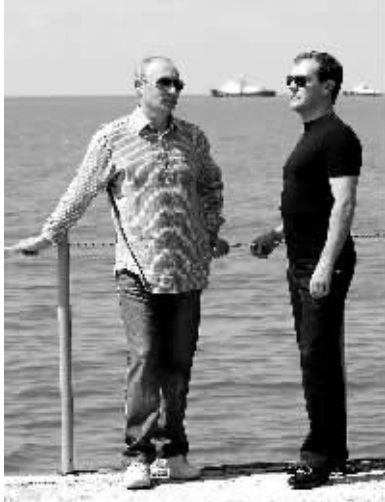
8月14日，俄罗斯总统梅德韦杰夫(右)与总理普京在俄南部黑海沿岸城市索契交谈。

新华社专电 阿富汗总统哈米德·卡尔扎伊同父异母的弟弟、坎大哈省议会会议长艾哈迈德·瓦利·卡尔扎伊13日否认英军在他拥有的土地上查获数吨鸦片的报道。 德国《明星》周刊先前报道，英军特种部队在坎大哈省属于艾哈迈德·瓦利·卡尔扎伊的土地发现大批鸦片。 艾哈迈德·瓦利·卡尔扎伊13日打电话告诉路透社记者：“这是选举期间，他们想用这种新闻来破坏总统形象，事情就是这样。” 当被问及究竟是谁想破坏总统形象，艾哈迈德·瓦利·卡尔扎伊说：“我不知道，谁写了这篇报道就是谁。” 他还说，自己对英军查获鸦片的事毫不知情，即使确有发生，也没有证据证明鸦片就被发现在自己土地上。“他们能给我看看这块地么？我请求英国特种部队向我证明他们确实从我家土地上发现所谓的鸦片。”