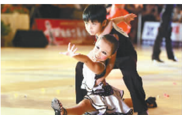
←翩翩起舞。 →漂亮造型。

据了解,大赛分为摩登舞系列、拉丁舞系列、集体舞系列等三个大项。比赛分成预赛、复赛、半决赛、决赛等阶段,各分项决赛的前12名选手都将获得奖牌、证书等。