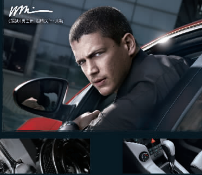
S6六速手自一体变速箱