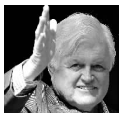
这是2008年5月21日拍摄的爱德华·肯尼迪走出位于美国波士顿一家医院的资料照片。