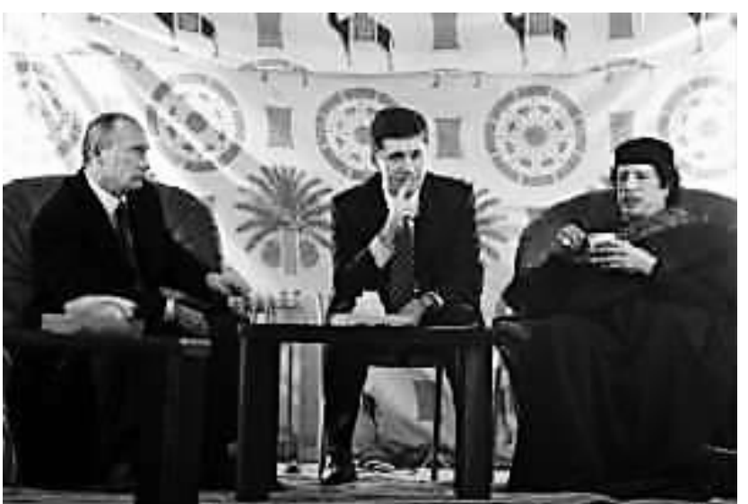
去年11月1日,俄罗斯总理普京(左一)来到利比亚领导人卡扎菲(右一)搭建在莫斯科克里姆林宫的贝都因人帐篷内会见卡扎菲。