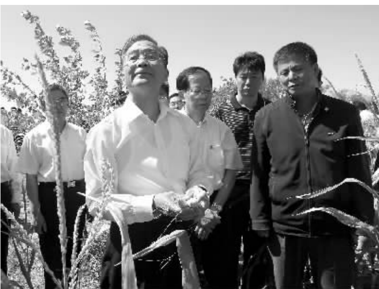
这是8月28日温家宝来到赤峰市敖汉旗玛尼罕乡一处受灾绝收的农田里,仔细察看旱情。

据新华社呼和浩特8月29日电(记者赵承)中共中央政治局常委、国务院总理温家宝近日在内蒙古检查指导抗旱减灾工作时指出,近一段时间我国部分地区出现较严重的旱情,对农业生产和群众生活造成较大的影响。党中央、国务院高度重视旱情和抗旱工作,各受灾地区及时启动抗旱应急响应,积极采取有效措施,抗旱减灾取得了初步成效。但是,目前北方旱情还在发展,南方部分地区又有新的旱象。全国农作物受灾面积还在扩大,人畜饮水困难的数量还在增加。受灾地区的各级党委和政府必须充分认识做好抗旱减灾工作的极端重要性,切实把抗旱减灾作为当前“三农”工作中最紧迫、最重要的任务,扎实做好各项工作,努力争取今年农业有个好收成。我国粮食连续五年丰收,储备充足,国家经济实力提升,完全有能力战胜这场灾害,保障粮食供给,维护经济发展和稳定的大局。