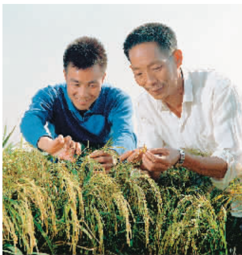
1976年12月，袁隆平(右)和同事李必湖在观察杂交水稻生长情况(资料照片)。