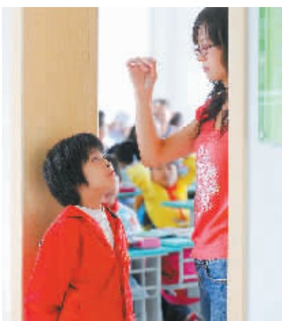
安徽省各学校在开学后做好甲型H1N1流感疫情的监测和防控工作。图为合肥市屯溪路小学老师为一名小学生测体温。

三是继续加强新闻宣传和健康教育。各地卫生部门要继续加强与新闻媒体的密切合作，及时向公众发布突发疫情信息和防控工作进展，宣传甲型H1N1流感预防知识，引导公众科学认识甲型H1N1流感，积极参与防控工作。