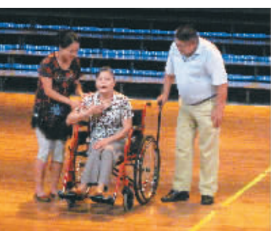
小品《丈夫的外遇》南京演出剧照

本报讯(记者卫小林)第七届全国残疾人艺术汇演(江苏赛区)比赛日前在南京落幕,我省选派了46位演职人员组成的代表队参赛,结果11个参赛节目全部获奖,这是海南日报记者从我省有关部门获悉的。 据介绍,我省选派参加第七届全国残疾人艺术汇演(江苏赛区)比赛的11个节目,是经今年6月5日海南省首届残疾人文艺汇演赛后,从16支代表队的44个获奖节目中遴选出来的。在南京赛区的比赛中,经过与来自上海、江西、山东、安徽、