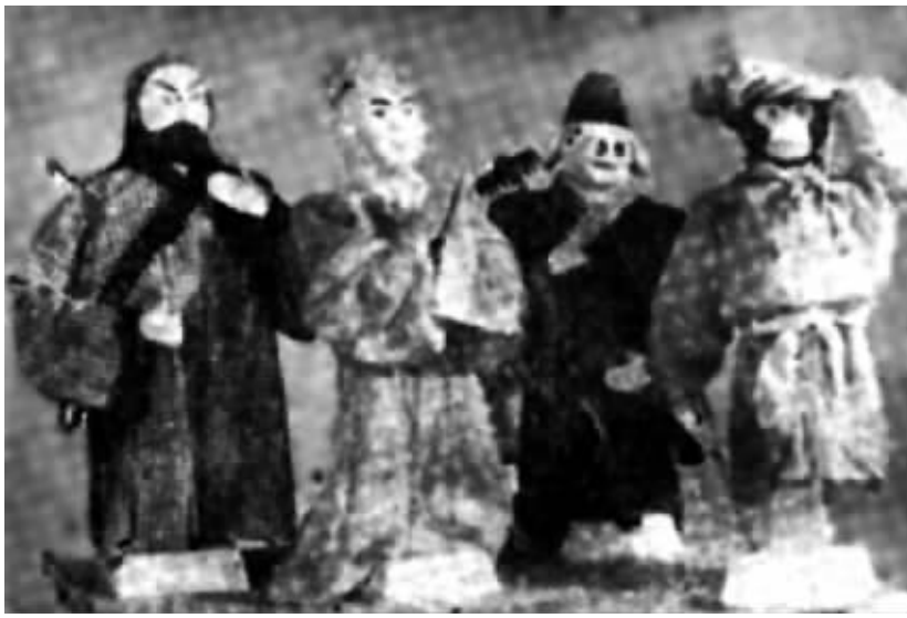
1959年“十月革命”四十周年之际,海南华侨中学少年木偶剧团团员制作的《西游记》人物木偶头型送进苏联博物馆。

斑驳的画面不是很清晰,但是中国传统名著《西游记》中唐僧、孙悟空、沙僧和猪八戒的造型依然可以一眼就认得出来。只是师徒四人无论是从服饰造型还是面部表情,都显示出这并不是一个专业的工艺美术工作者的作品,而是业余爱好者的兴趣之作。就是这样一组略显粗糙的木偶头型,在1959年时,海南华侨中学少年木偶剧团为庆祝“十月革命”40周年,作为礼物送给了当时的苏联。