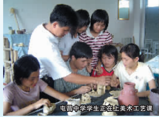
屯昌中学学生正在上美术工艺课

三年来，屯昌高考600分以上学生，分别为120人、161人、204人；考生平均分分别为479分、499分、532分；三本以上入围人数分别为455人、479人、646人，都在逐年增加。从中考来说，中考满分人数明显增加，2007年中考总分满分5人，去年32人，今年115人；中考单科满分人数明显增加，前年1045人，去年1947人，今年2522人；高分段学生人数明显增加，70分以上人数，去年228人，今年401人；80分以上人数，去年65人，今年175人。特别是县重点中学屯昌中学中考成绩显著，中考优秀率和良好率都居全省各中学第3名，及格率和平均分均居全省各中学第4名。