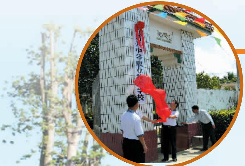
与潮汕职业学校合作办学、实行三段式教育的县职业技术学校开学仪式