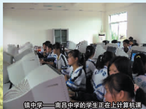
镇中学——南昌中学的学生正在上计算机课

今年，屯昌又面向全国引进高中学科带头人5名，每人年薪不低于5万元，年度考核合格者奖励1