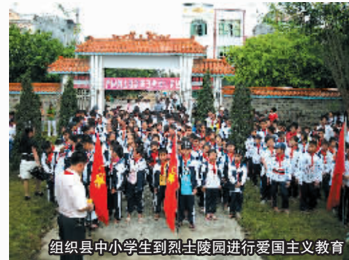
组织县中小学校生到烈士陵园进行爱国主义教育

2007年，县政府拨款33.1万元，率先在全省参照发放高中教师绩效工资津贴。2008年，县政府拨款24.9万元发放幼儿园教师绩效工资，教师绩效工资