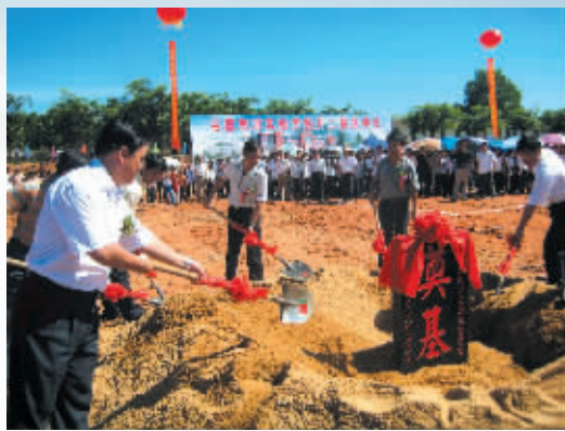
屯昌县思源实验学校开工奠基仪式