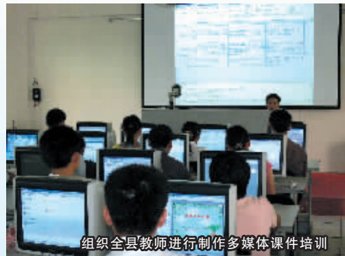
组织全县教师进行制作多媒体课件培训

为了在全县中小学校营造鼓励竞争、贡献和成才的良好氛围，在全县营造尊重知识、劳动和人才的教书育人环境，2007年，屯昌县委、县政府出台了《屯昌县有突出贡献的中小学教师实行政府特殊津贴暂行办法》、《屯昌县优秀中小学校长奖励暂行办法》、《屯昌县奖教奖学暂行办法》等三个奖教奖学办法。