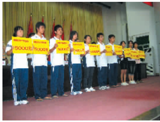
屯昌县2008年奖教奖学大会助学捐款仪式