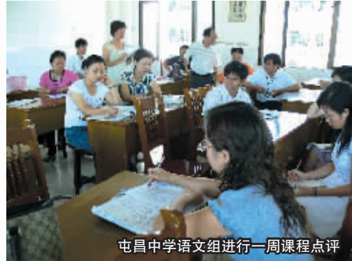
屯昌中学语文组进行一周课程点评

在人们的印象中，屯昌并不是全省的教育大县，甚至还因办学成绩不明显在2006年引发一条轰动一时的新闻：全县最好的一所完全中学——屯昌中学，因学校的各项教育工作与周边市县的兄弟学校相比差距较大，办学成绩不明显，校长和两名副校长被县委、县政府宣布就地免职，由县长范高净兼任校长，组织和主持学校新班子的竞聘、招聘等各项改革工作。