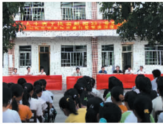
邀请本县籍残疾人乒乓球世界冠军虞海蓬到屯昌中学作励志报告