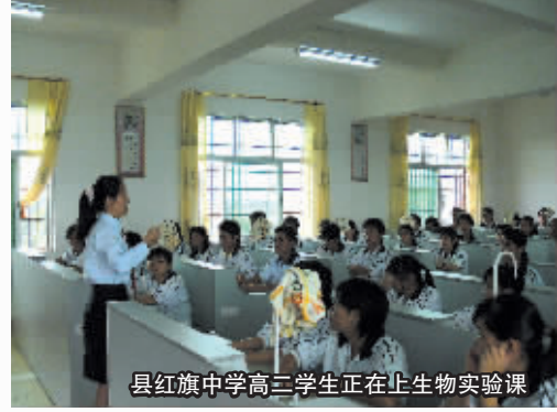
县红旗中学高三学生正在上生物实验课

从高考来说，考生总分最高分逐年增加，2007、2008、2009年全县最高分分别为762分、806分、