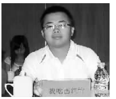
网络小说“小财主”——“我吃西红柿”近照