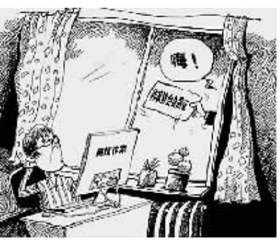
网络写手,一个带着青春和梦想的名词。

段时间,一早起来,坐着对屏幕发呆。在网上四处看看,一天很快就过去了。”他说,“当时想得最多的是要不要继续写。不过,原来那种为了自我表达而写作的模式转成“准工作”之后,味道就不一样了。” “理科大脑”,更适合网络写作? 2003年起点中文网推出付费阅读,