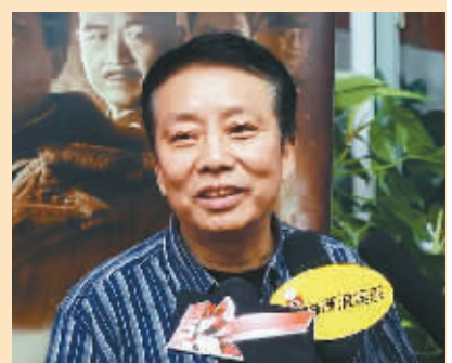
导演黄建新回答媒体提问

献礼巨片《建国大业》9月16日全国公映后,观众反响热烈。导演韩三平和黄建新日前接受媒体专访,详解了热映盛况。