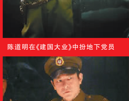
刘德华在《建国大业》中跟了蒋介石