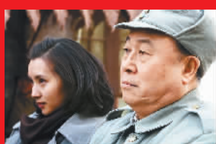
《建国大业》中的傅作义(右)和女儿