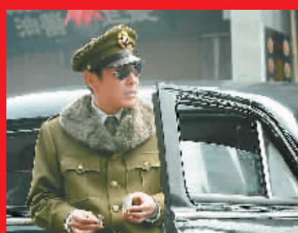
陈道明在《建国大业》中扮地下党员