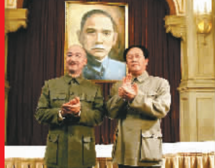
《建国大业》中的毛泽东(右)和蒋介石

很多东西在影片里面得到了很好的表现。百余位大牌明星合演一部主旋律电影,是很少见的一种样式,以前还没有过。之前,大家会很担心这样做会淹没情节,把电影变成一场宴会。但事实上并没有,观众大都进入了演员所塑造的角色,尽管有的角色出场才两三分钟,但每个场景都有故事有戏,这点非常不容易。这部电影开创了主旋律大片按商业化模式运作的新方式,颠覆了很多中国电影制作当中的观念,不再像以往的主旋律电影,总是表现领袖们开会,开会都是“三句半”,不再用电影承载那么多教化功能。而模仿纪录片的拍法,以及在纪录片、特技合成、历史资料的有机结合方面所做的尝试,也让专家们倍感惊喜。(范晨)