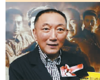
导演韩三平接受媒体访问