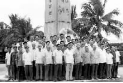
↑ 1950 年代初,参加海榆中线建设的老同志在纪念碑前合影。

2001 年 3 月 23 日,省交通厅在新的碑址上举行奠基仪式,年底,新的公路烈士纪念碑落成。新建的纪念碑占地面积共 7000 多平方米,整个规模比原有纪念碑要大。