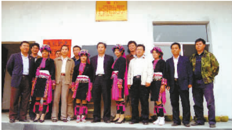
2008年1月28日，深入乐东县少数民族村庄调研的省财政厅厅长陈海波和当地群众在一起。

2008年，省财政厅牵头编制2008—2012年民生规划并经省委五届三次全会审议通过，确定5年共计筹集452亿元，