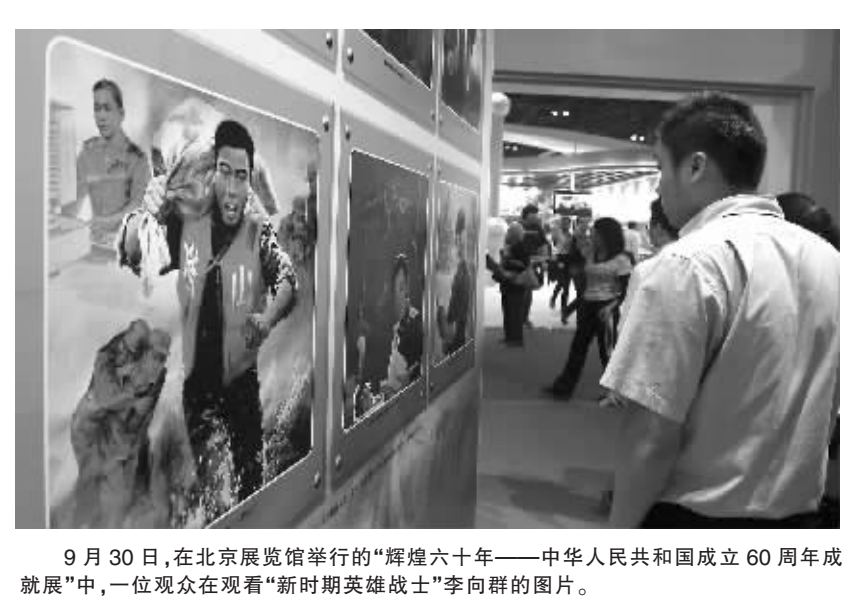
9月30日，在北京展览馆举行的“辉煌六十年——中华人民共和国成立60周年成就展”中，一位观众在观看“新时期英雄战士”李向群的图片。