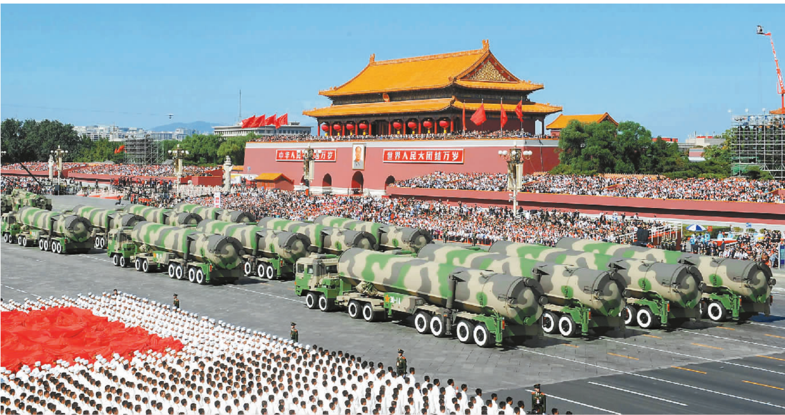
核导弹方队接受检阅。