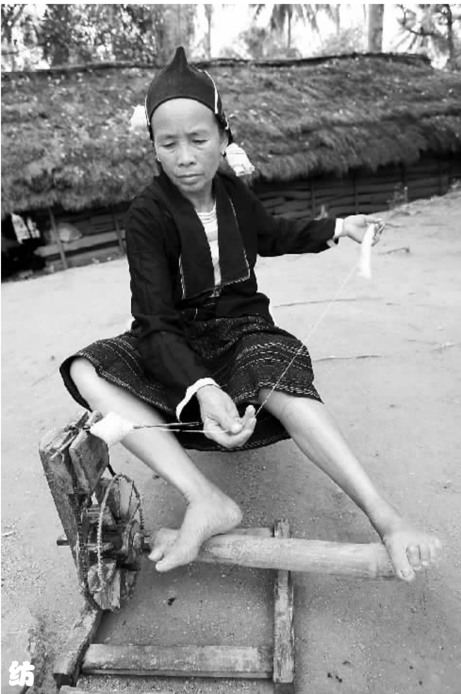
昌江七叉镇机构村的黎族妇女用传统的方式将海岛棉纺成线。

黎族棉纺织业按照不同的方言,在应用工艺上各有侧重。其中,杞、赛方言以彩纬彩经显花编织为主,用绣较少;润方言则以绣为主,其双面绣技艺高超;哈方言则织绣双全;而美孚方言最突出的工艺是缟染。