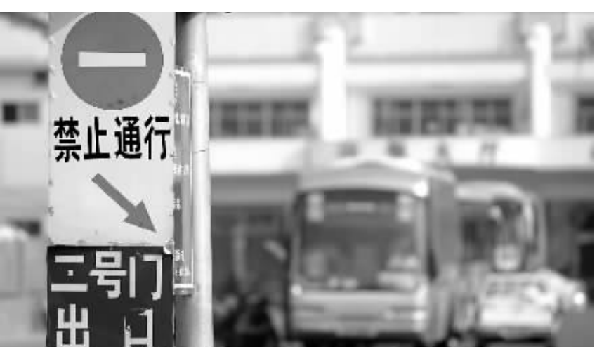
海口某港口码头,标识牌缺少英文。

据介绍,在《条例》出台的同时,我省还将制定与其相配套的《海南省公共信息标志标准实施目录》。