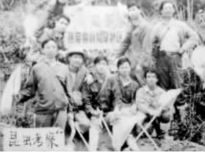
1980年代,科研人员在尖峰岭考察