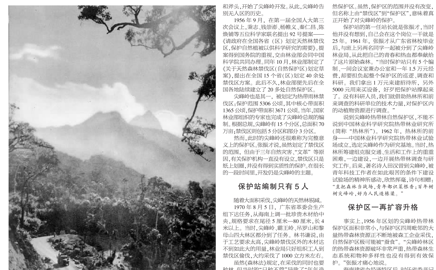
1960年代的尖峰岭。