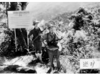
1970年代,保护区内的护林员在巡逻

取票地点:1.海口市海府路49号原省委大院第二办公楼三楼省社科联311房(电话:65365081);2.海口市国兴大道省图书馆一楼总咨询台;3.省新华书店解放西路购书中心、南沙路科技书店、人民大道海南书店收银台 网上订票:海南社会科学网(http://www.hnsl.net) 取票时间:10月28日8:30开始,领完为止 免费听讲 凭票入场 不编座号 先到先坐