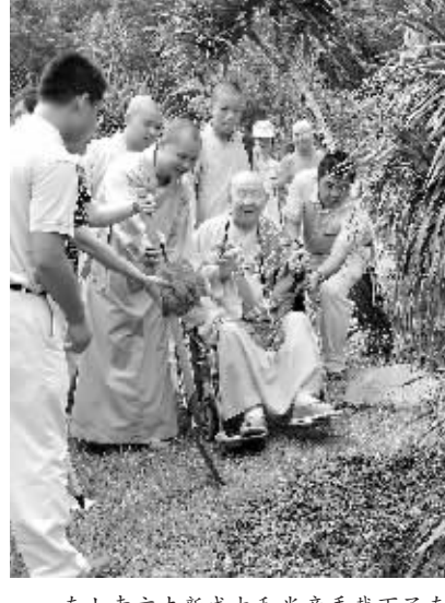
南山寺方丈新成大和尚亲手栽下了南山不老松。