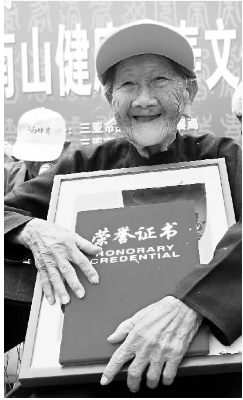
来自定安的百岁老人兴高采烈地参加活动。