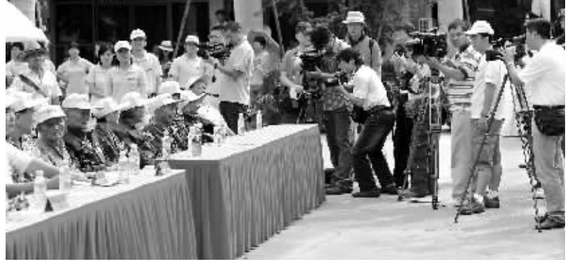
来自中央电视台等30多家媒体聚焦南山长寿文化节。