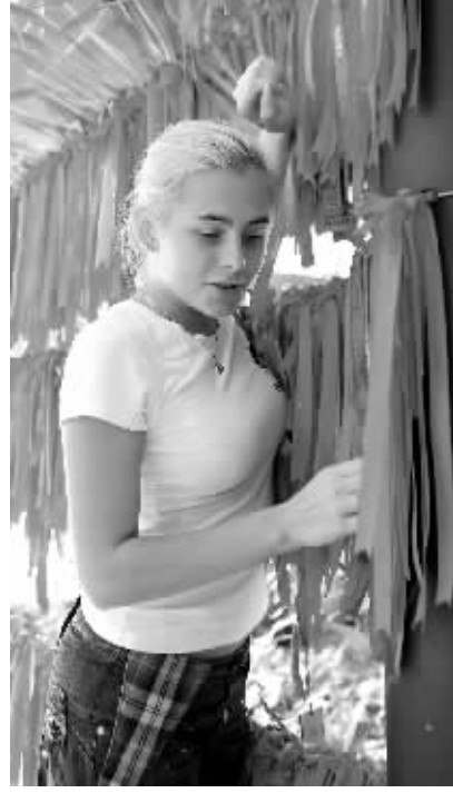
俄罗斯游客在长寿谷祈福。