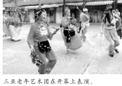
三亚老年艺术团在开幕式上表演。