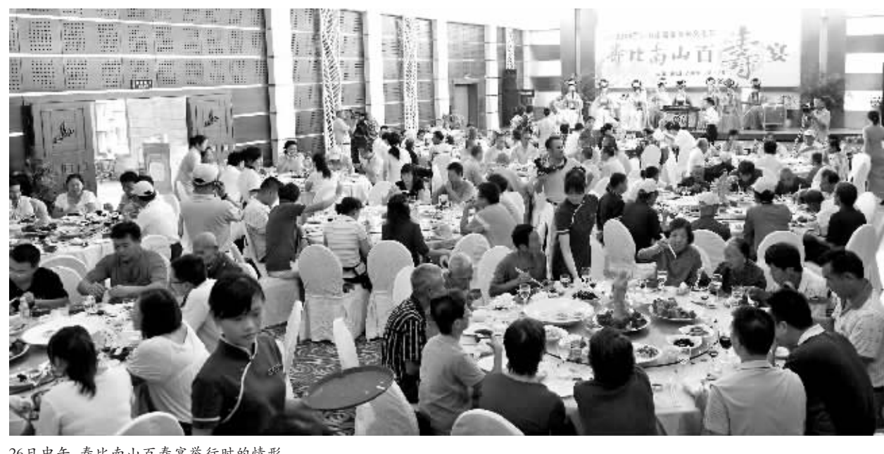
26日中午,寿比南山百寿宴举行时的情形。