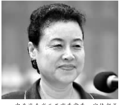
中共海南省三亚市委常委、宣传部长张萍讲话时的情形。