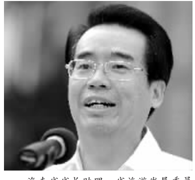
海南省省长助理、省旅游发展委员会主任陆志远讲话时的情形。