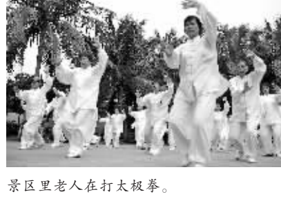
景区里老人在打太极拳。