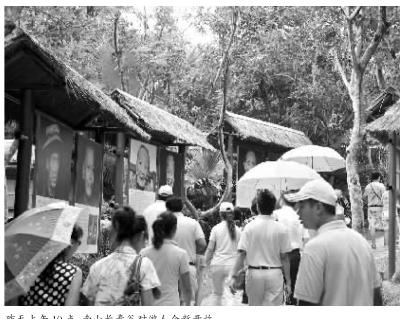
昨天上午10点,南山长寿谷对游人全新开放。