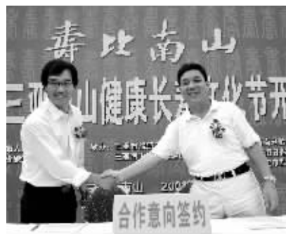
海南益寿机制课题研究合作意向签订。