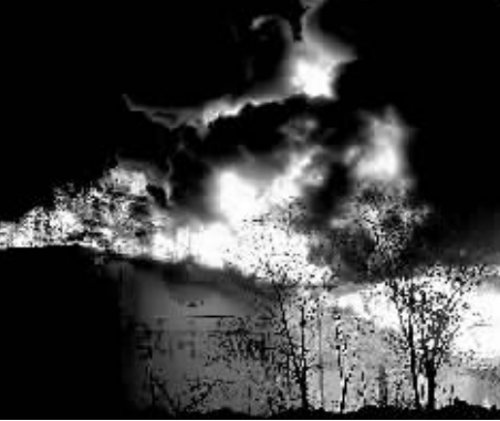
印度西部油库火灾现场。

据印度媒体30日报道,发生在印度西部拉贾斯坦邦斋浦尔的火灾已造成13人死亡、150多人受伤。目前,火势仍未得到控制。