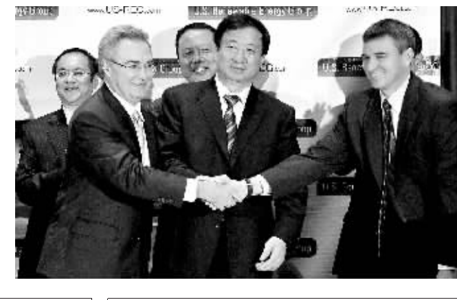
沈阳能源集团和美国可再生能源集团及美国风能有限公司代表在签字仪式上握手。

在新能源领域的合作近年来已成为中美经贸合作的一个亮点。美国一家太阳能公司上月宣布,将在中国内蒙古建设一座2000兆瓦的太阳能光伏发电厂,这也将是世界上最大规模的太阳能光伏发电项目。